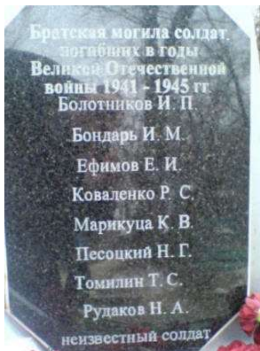
Мемориальный обелиск на братской могиле воинов в пос. им. Артема.