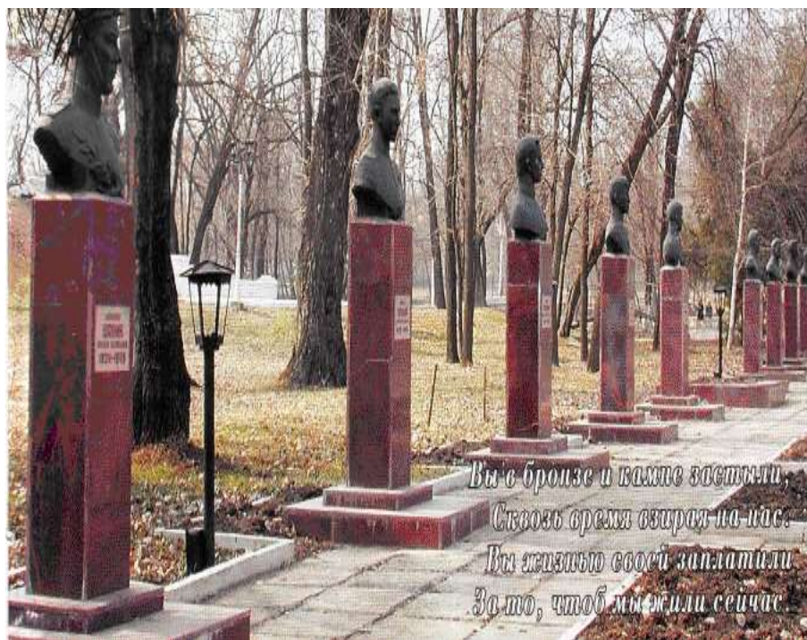
Аллея Героев Советского Союза в г.Шахты.