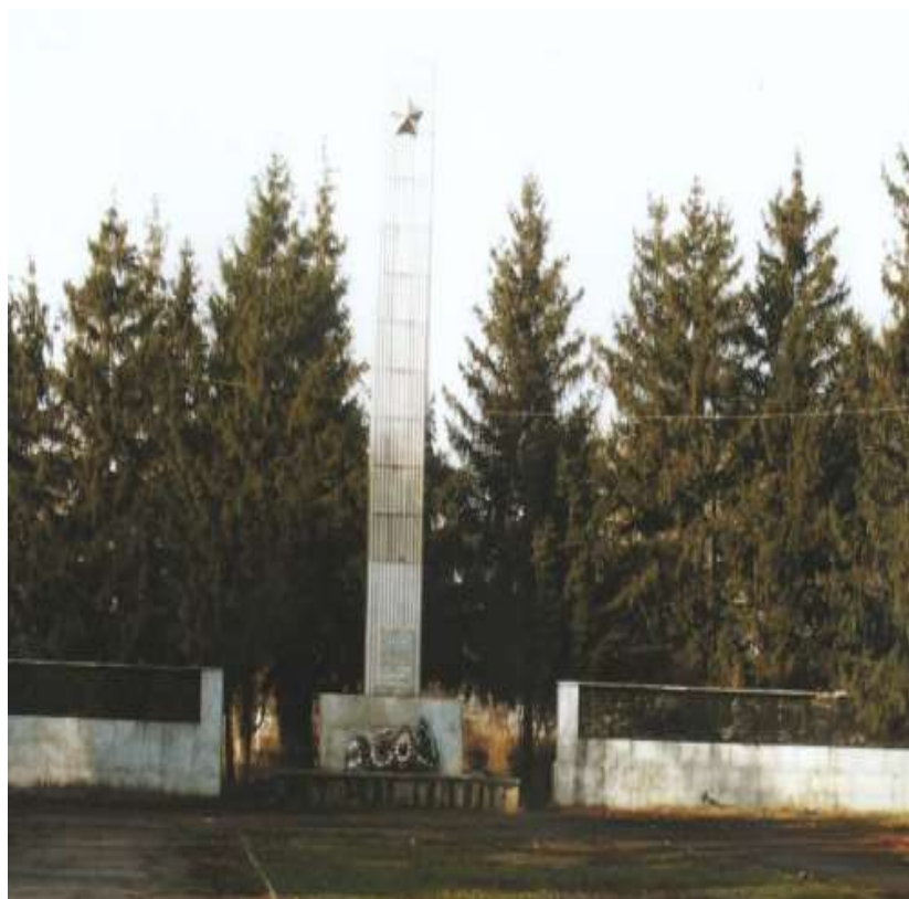
Мемориальный комплекс на "Площади Славы" в пос. им. Артема.