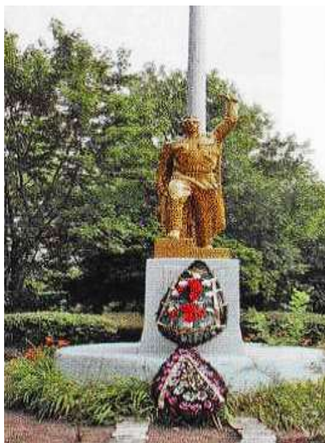
Мемориал в п. Сидорово-Кадамовском.