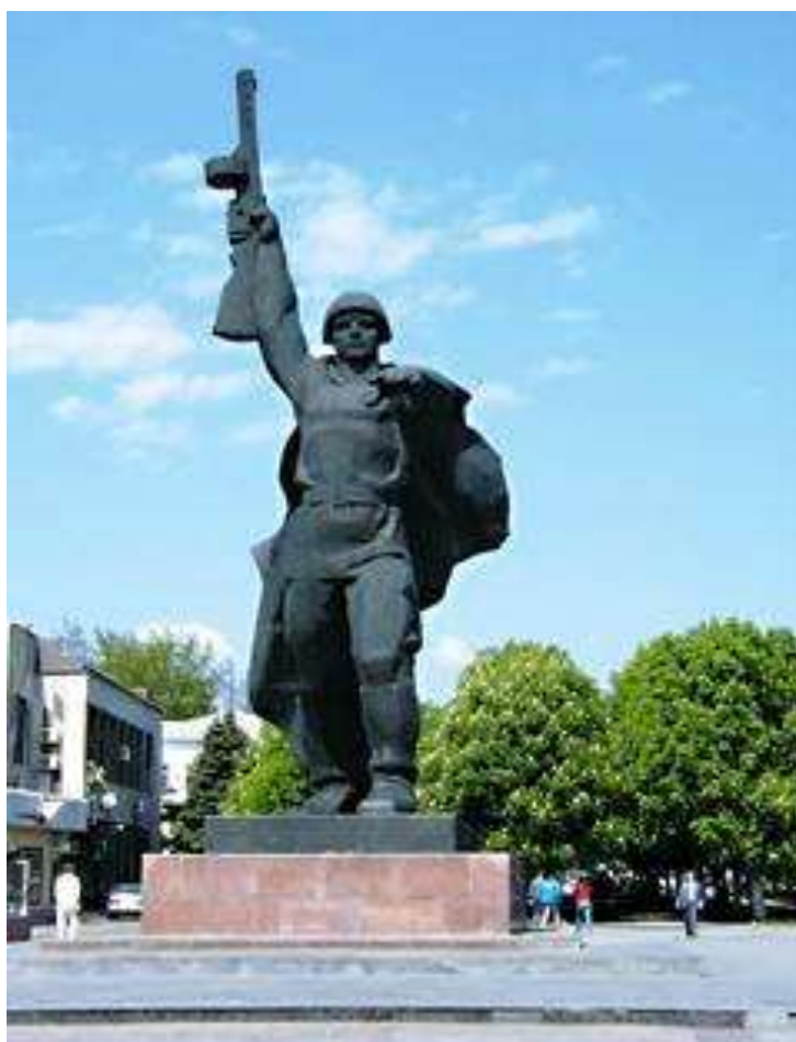
Памятник Солдату - освободителю в г.Шахты