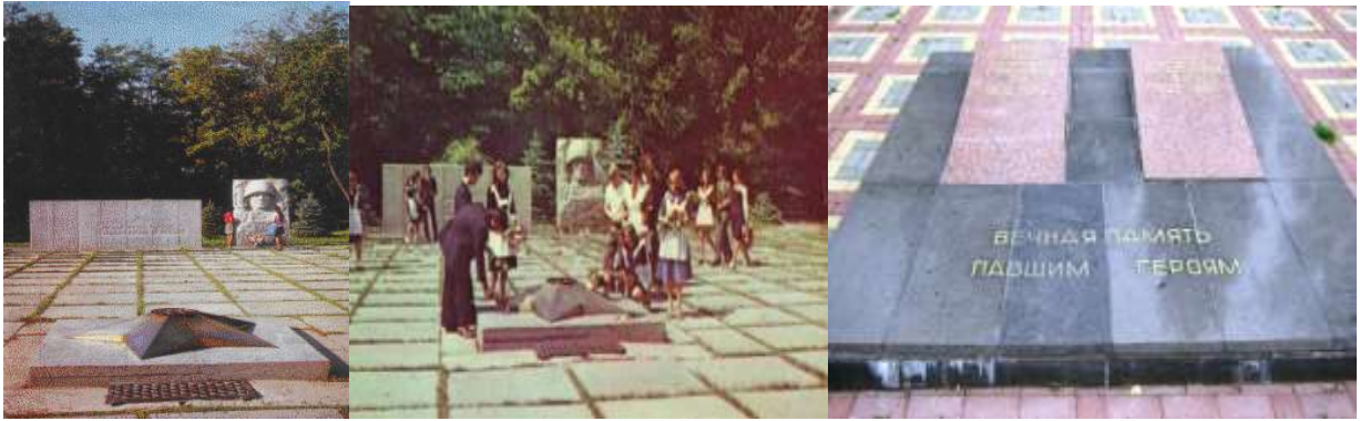
Мемориальный комплекс в парке культуры и отдыха города Шахты.